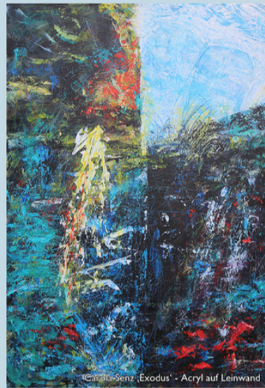
Carola Senz „Exodus“ - Acryl auf Leinwand

Mit dem Begriff ‚Exodus‘ ... dem ‚Auszug‘ der Israeliten aus Ägypten, wurde eine Fluchterfahrung, die immer die Hoffnung auf völligen Neubeginn beinhaltet, zum Neubegriff und Synonym für Befreiung rechtloser und unterdrückter Menschen schlechthin.